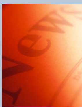
Notícias dos Clubes