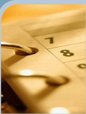
Agenda do Governador